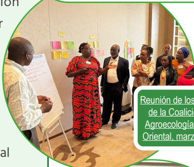
Reunión de los miembros de la Coalición por la Agroecología de África Oriental, marzo de 2025

Organización de reuniones regionales de los miembros de la Coalición por la Agroecología junto con eventos regionales