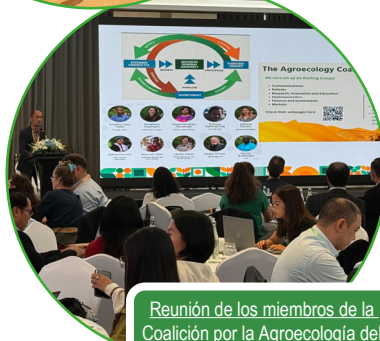
Reunión de los miembros de la Coalición por la Agroecología del Sudeste Asiático en la Conferencia TARASA2025 en la República Democrática Popular Lao en noviembre de 2025