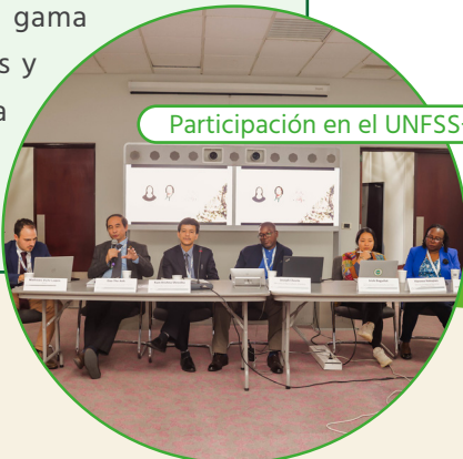
Participación en el UNFSS+4