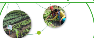
Agroecology in Action: Stories from the Ground Second Edition