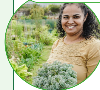
Reuniones de donantes sobre agroecología 2023 y 2025

Herramienta de evaluación de la financiación de la agroecología y su uso/aplicación por parte del BMZ, la CE, la AICS y el IDRC