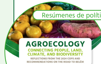
AGROECOLOGY CONNECTING PEOPLE, LAND, CLIMATE, AND BIODIVERSITY REFLECTIONS FROM THE 2024 COPS AND RECOMMENDATIONS ON THE ROAD TO BELÉM

The outcomes of the 2024 Rio Convention COPS underscore the necessity to enhance and utilize synergies among the Conventions. Agroecology is a promising approach that simultaneously contributes to goals of the UNFCCC, CBD, and UNCCD. By adopting a systemic approach to food system transformation based on agroecological principles, countries can achieve multiple socio-ecological and economic goals, fulfilling their commitments to the Rio Conventions.