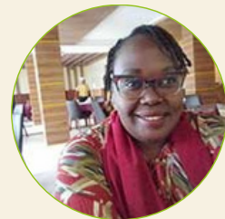
Monicah Yator Indigenous Women and Girls Initiative