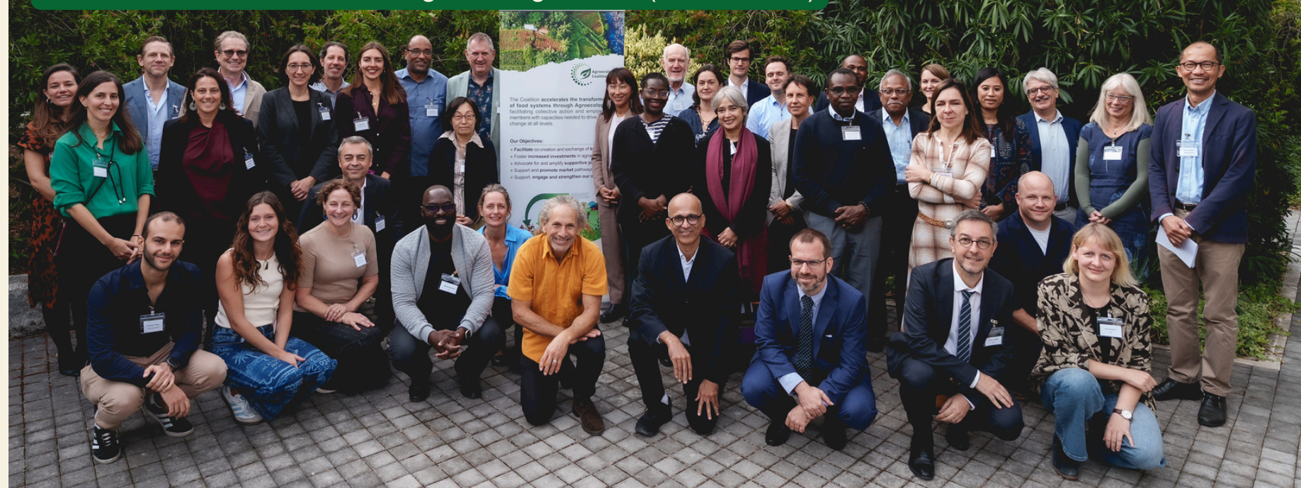
Evento Paralelo del Foro Mundial de la Alimentación de la FAO (Roma, Italia)