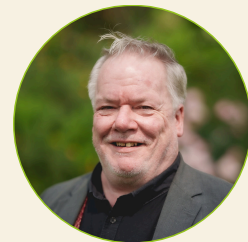
Fergus Sinclair Agroecology TPP