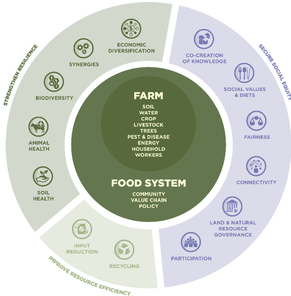
Figure 2: Liens avec la Coalition Agroécologie